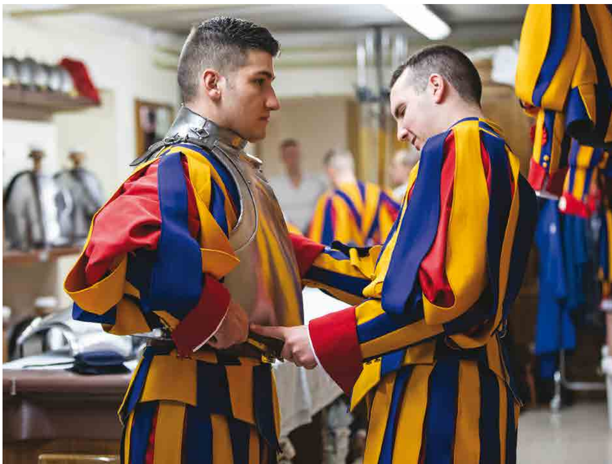
Die von der Gardestiftung gespendeten Harnische kamen dieses Jahr lediglich an der Vereidigung am 4. Oktober zum Einsatz

Dadurch gestaltet sich die Spendenakquisition in diesem Jahr schwierig. Es müssen noch einige Anstrengungen unternommen werden, um 2020 die benötigten finanziellen Mittel aufbringen zu können. Die Lücke sollte bis Ende Jahr durch weitere Spenden