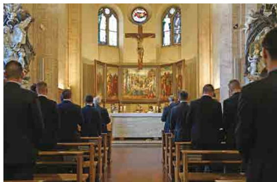
La Messe au Collegio Teutonico