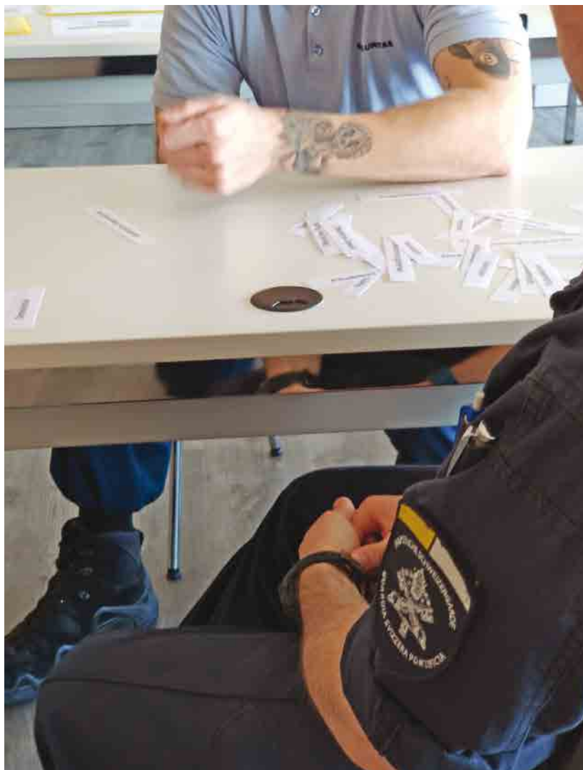
L'échange et l'apprentissage avec des membres des sociétés de sécurité privées sont toujours une valeur ajoutée pour les gardes

Texte et Photo: Vcpl Tobias Renner Traduction par Vcpl Alexandre Furrer