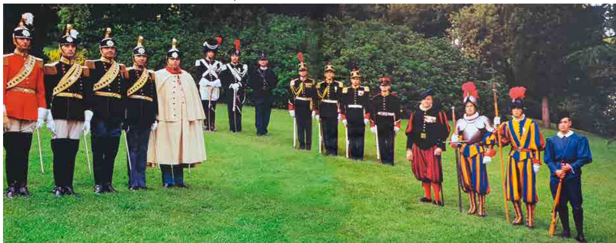
Die vier Päpstlichen Garden in ihren verschiedenen Uniformen

W.S.: „Oberst Nünlist informierte die Truppe im Ehrenhof der Kaserne über den Entscheid des Papstes. Der Kommandant stand vor der Truppe, sehr bleich und sprach fast etwas stotternd. Ungewohnt für Oberst Nünlist. Fast etwas ausschweifend erzählte er von der Begegnung mit dem Papst. Wir dachten uns: „Red nicht um den Brei herum, sag uns einfach, dass es die Schweizergarde nicht mehr geben wird!“ Dann natürlich die riesige Überraschung. Wir waren natürlich extrem überrascht. Wir rechneten fest damit, dass die Schweizergarde aufgehoben wird. Wir waren erfreut, aber die Sorge darüber, wie es weitergehen sollte, war grösser. Der Bestand der Garde war ca. 40 Mann (aktueller Sollbestand 135 Mann). Wir hatten nur ca. 2 bis 3 Neueintritte alle paar Monate. Die Kommentare unserer Offiziere, dass Paul VI. ein guter Papst sei und dass er hinter der Schweizergarde stehe, waren zwar schön, halfen uns aber augenblicklich nicht weiter. Ohne die Nobel- und Palatingarde konnten wir gut leben. Wie es mit der Gendarmerie weiterging, wussten wir nicht. Wie werden die Aufgaben neu verteilt? Welche neuen Kompetenzen erhalten wir? Wir fragten uns einfach: Wie können wir ohne neue Gardisten unseren edlen Auftrag überhaupt weiterhin ausführen?“