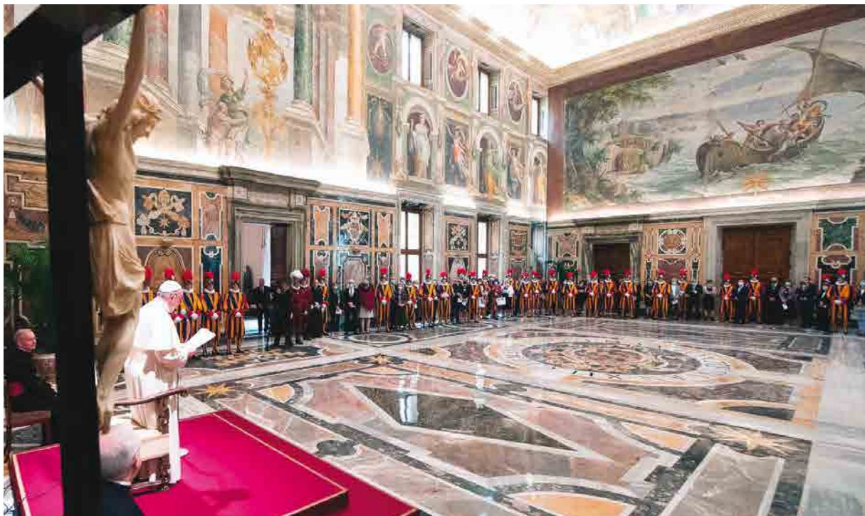
L'audience du Pape François aux gardes avec leurs parents dans la Sala Clementina à la II. Loge du Palais Apostolique