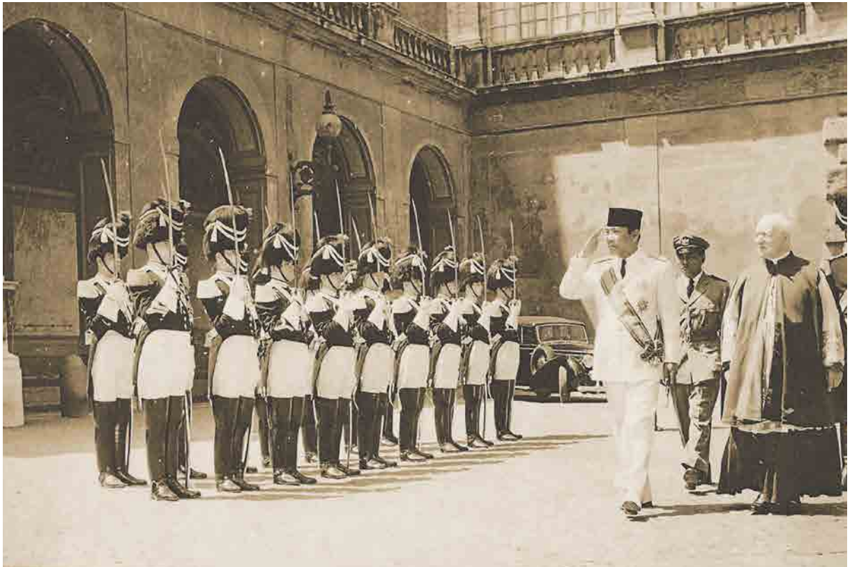
Die Päpstliche Gendarmerie beim Empfang des Präsidenten von Indonesien, Achmed Sukarno, im Jahr 1956 im Damassuhof des Apostolischen Palastes

dem Cortile di San Damaso und dem Cortile del Triangolo. Angehörige der „Associazione“ stehen für Dienste bei den Gottesdiensten und Zeremonien mit dem Heiligen Vater zur Verfügung, unterstützen auf vielfältige Weise die Arbeit des Apostolischen Almonensamtes oder helfen in der „Casa del Dono di Maria“ von Mutter Teresa mit.