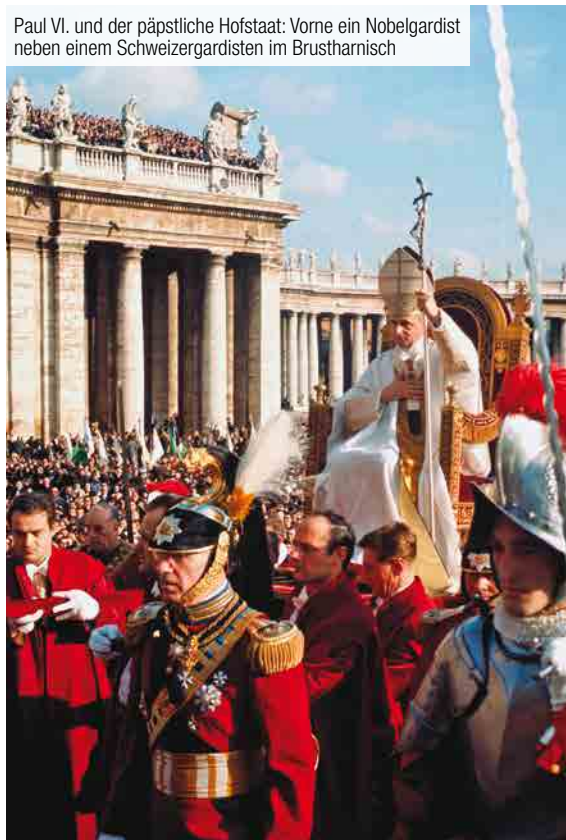
Paul VI. und der päpstliche Hofstaat: Vorne ein Nobelgardist neben einem Schweizergardisten im Brustharnisch

(4. – 6. Januar 1964) verzichtete Papst Paul VI. auf das Geleit durch die Nobelgarde; das Korps musste sich damit begnügen, bei der Abreise und Rückkehr des Pontifex im Damasushof des Apostolischen Palastes die militärischen Honneurs zu erweisen. In den folgenden Jahren gab es weitere Anzeichen für eine veränderte Sicht auf die Präsenz und das Auftreten der päpstlichen Garden. So kam ab einem gewissen Zeitpunkt bei den Gendarmen die Gran-Gala-Uniform napoleonischen Zuschnitts samt ihrer hohen Bärenfellmütze ausser Gebrauch.