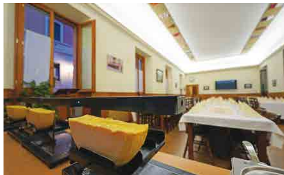
La Mensa prête pour la raclette