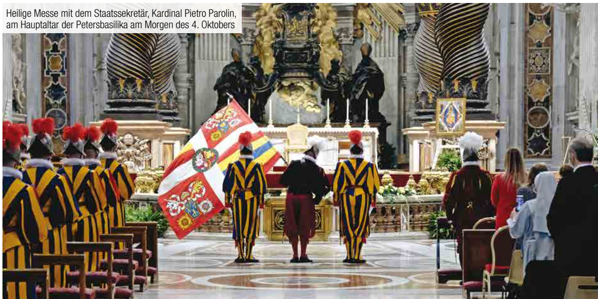
Heilige Messe mit dem Staatssekretär, Kardinal Pietro Parolin, am Hauptaltar der Petersbasilika am Morgen des 4. Oktobers